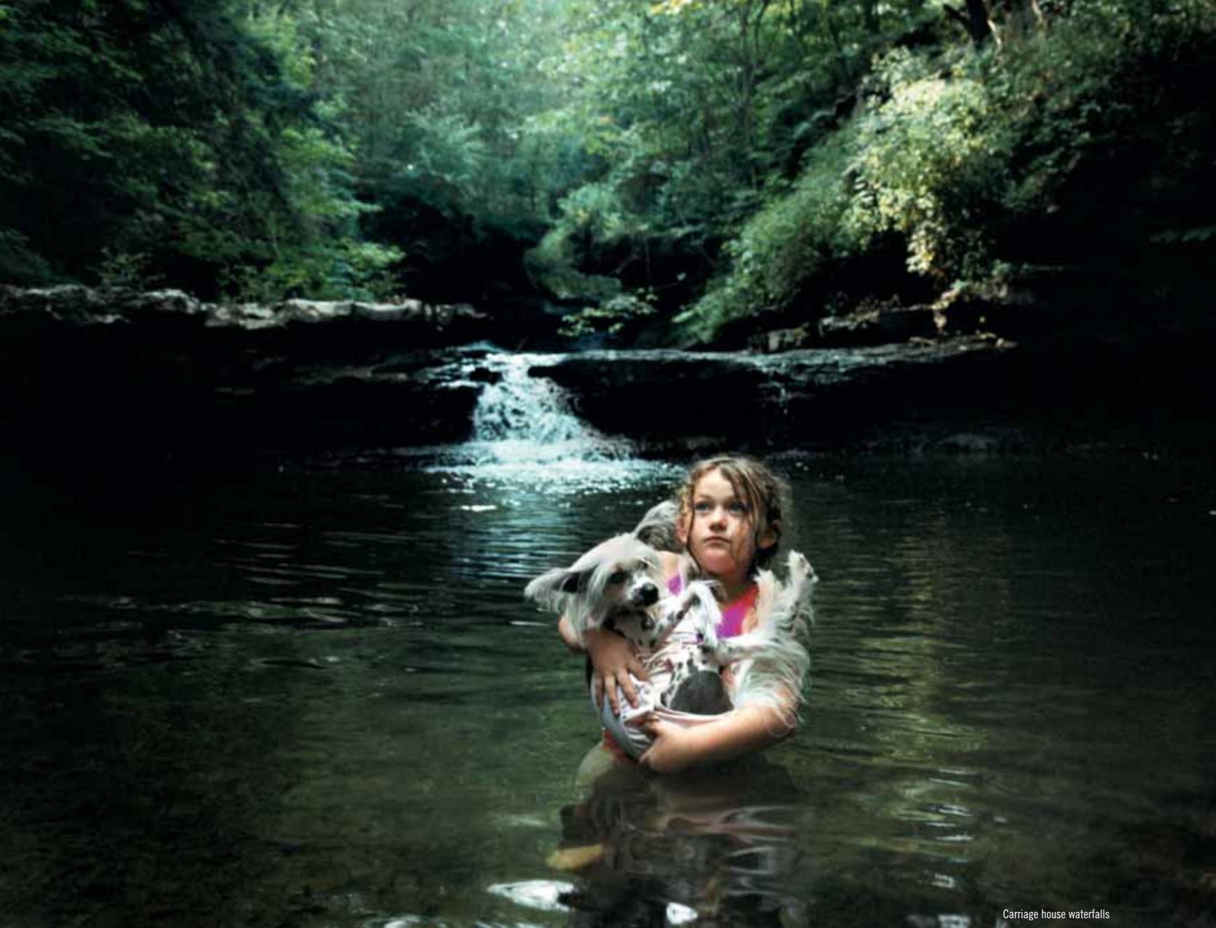
Carriage house waterfalls

donde no los había. Casi me limito a hacer ajustes de impresión”.